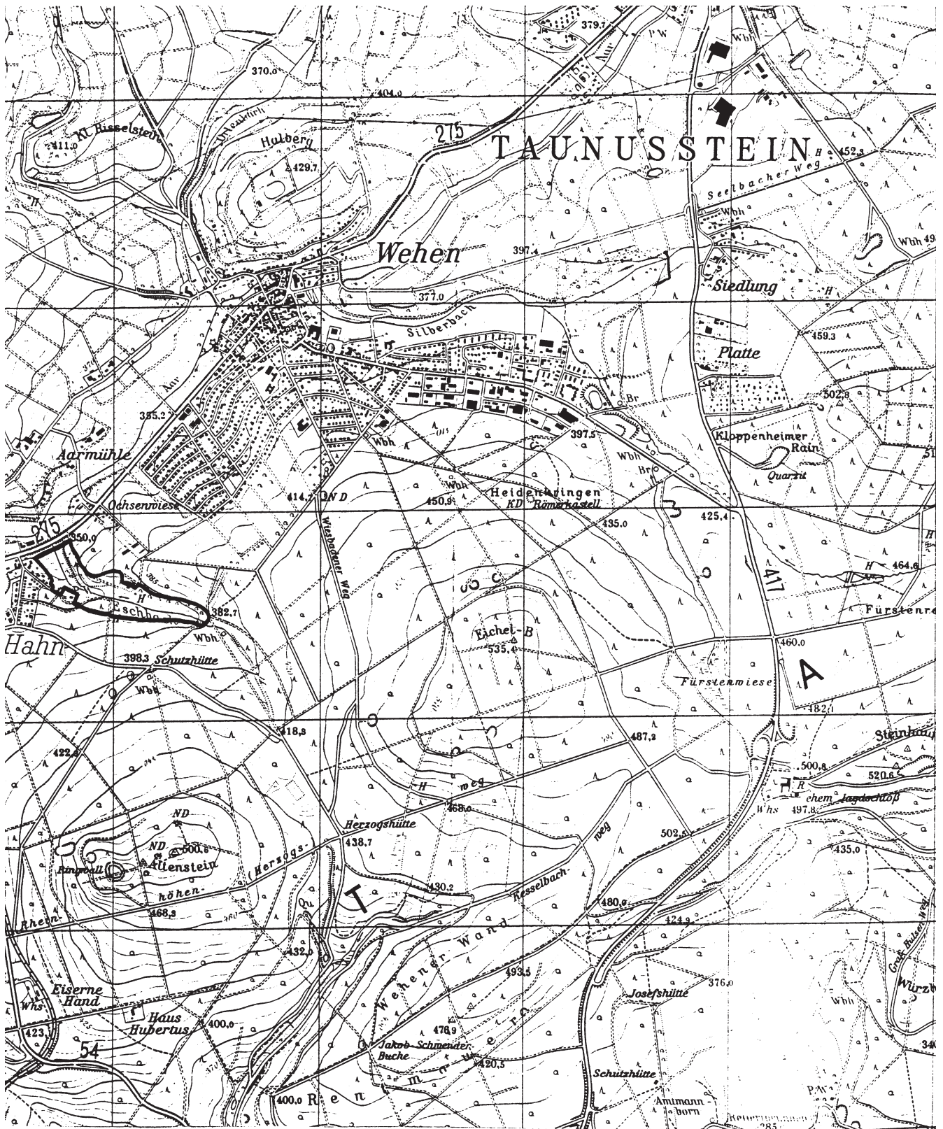
Anlage 1, Auszug aus Top. Karte, Maßstab 1 : 25 000, Blatt Nr. 5815, des Hessischen Landesvermessungsamtes, Vervielfältigungsgenehmigung Nr. 98 - 1 - 007